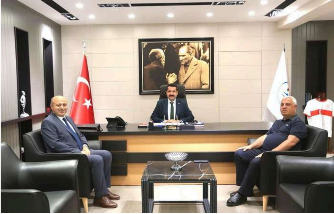
Pamukkale Belediye Başkanı Ziyareti