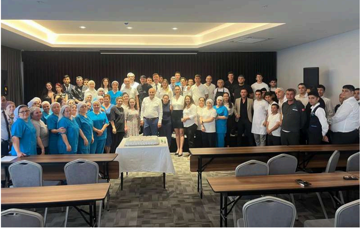
1 Mayıs Emek ve Dayanışma Günü Personel Kutlaması