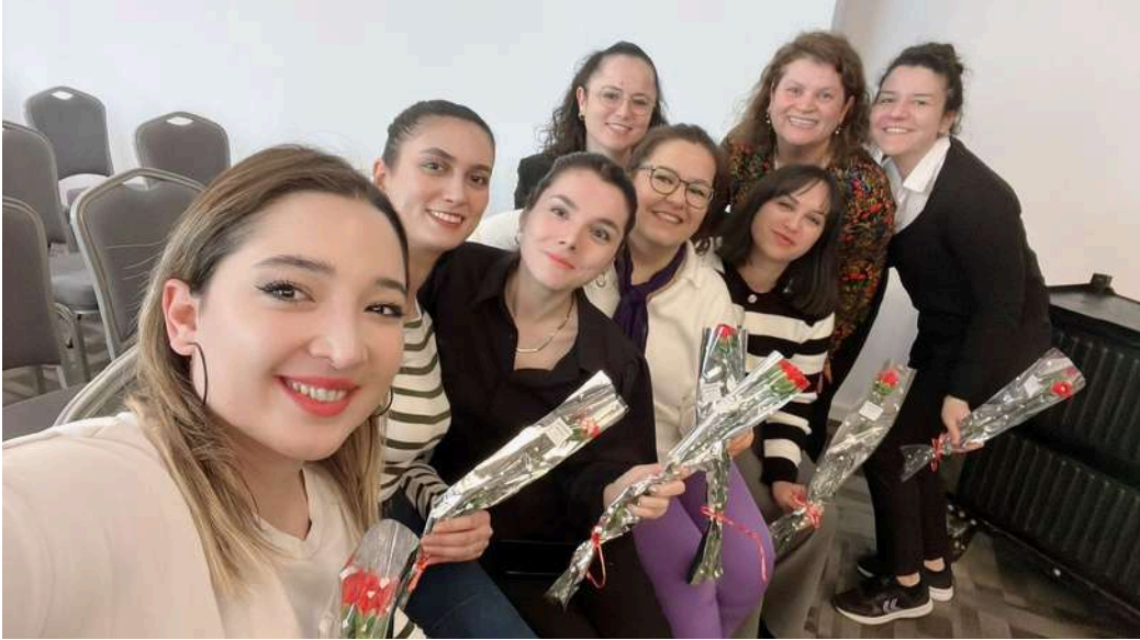
8 Mart Dünya Kadınlar Günü Kutlaması